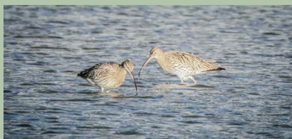
Grosse Brachvögel am Klingnauer Stausee.

Der Klingnauer Stausee hat eine immense Bedeutung für die Vogelwelt. Ein Ornithologe von BirdLife Aargau führt uns dem Stausee entlang auf den Spuren verschiedener wild lebender Vogelarten. Danach besuchen wir das Naturzentrum Klingnauer Stausee. Allgemeine Informationen zur lokalen Natur stehen da im Vordergrund. Eine einmalige Gelegenheit, ein für Vögel wichtiges Gebiet der Schweiz unter kundiger Führung kennenzulernen!